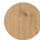
FRONT Artisan Eiche Nachbildung