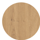
KORPUS Artisan Eiche Nachbildung

Metalleiste zur Verschraubung der Arbeitsplatte