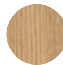
FRONT Artisan Eiche Nachbildung