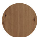
KORPUS Artisan Eiche Nachbildung

Metallleiste zur Verschraubung der Arbeitsplatte