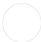
KORPUS Weiß Matt

Metallleiste zur Verschraubung der Arbeitsplatte