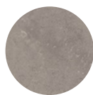
ARBEITSPLATTE Beton Optik